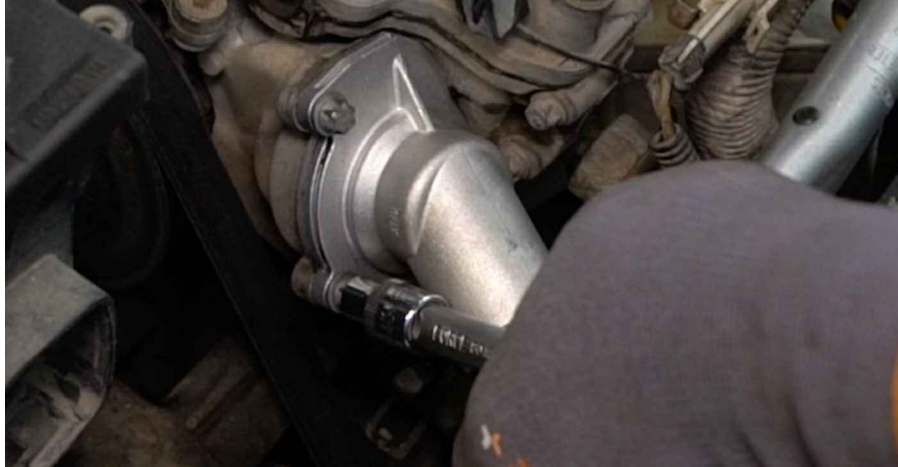
28 Bringen Sie den Kühlmittelschlauch an.