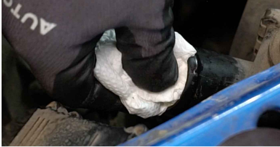
19 Reinigen Sie das Thermostatgehäuse. Benutzen Sie eine Drahtbürste. Verwenden Sie Allzweckreinigungsspray.