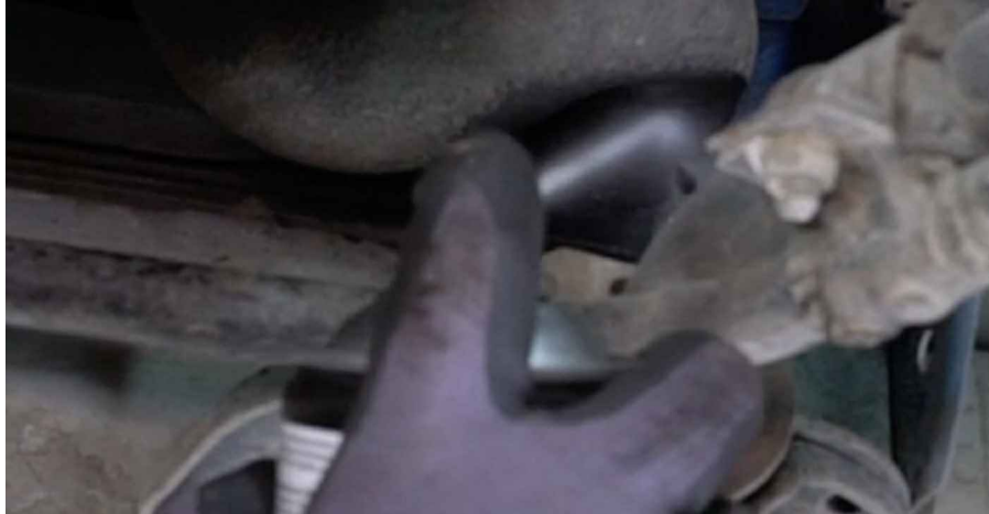
6 Bereiten Sie einen Behälter für Flüssigkeiten vor.