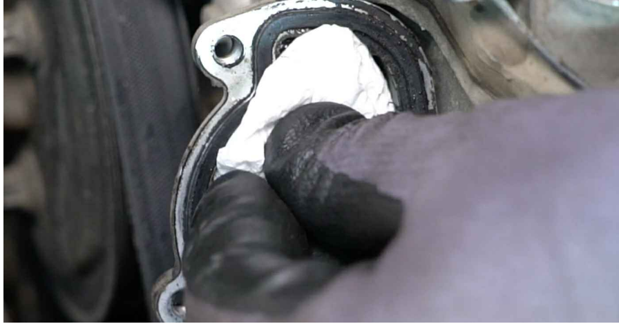
23 Entfernen Sie den Gummistreifen.