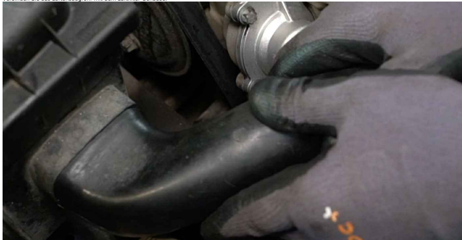
32 Bringen Sie die Klammer am Luftfilteransaugschlauch an.