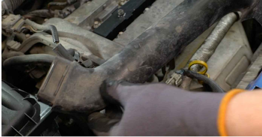
15 Reinigen Sie die Verbindungen des Kühlmittelschlauchs. Verwenden Sie Allzweckreinigungsspray.