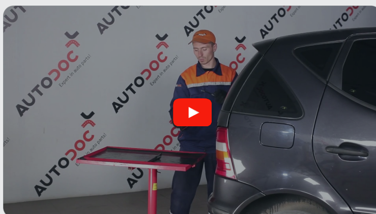
Dieses Video zeigt den Wechsel eines ähnlichen Autoteils an einem anderen Fahrzeug